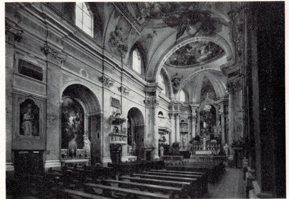
Die dem hl. Augustinus geweihte spätbarocke Klosterkirche zu Gries wurde 1769 bis 1771 von Anton Joseph Sartori erbaut. Den wertvollsten Schmuck bilden die Decken- und Altargemälde von Martin Knoller aus den Jahren 1771—1800.

Mit der Komplet schließt der klösterliche Alltag. Noch einmal preist der Mönch Gottes Güte und Liebe und kehrt schweigend, wie er den Tag begonnen, auf sein Zimmer zurück. Gute Nacht!